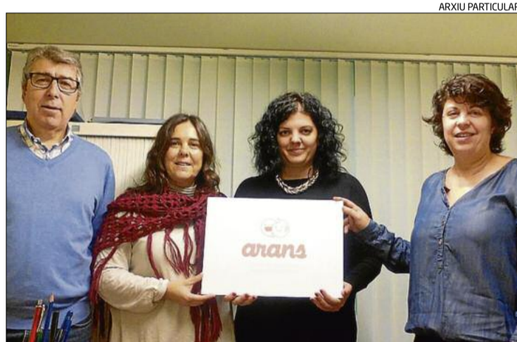
Membres de la junta d'Arans amb la dissenyadora que mostra el logo

El nou logotip d'Arans és una de les primeres accions que porta a terme la nova junta de l'entitat, que des del seu naixement treballa per obrir Arans a la ciutat i donar-la a conèixer. El logotip canvia el verd pel taronja i incorpora dues cares que simbolitzen els principals eixos de treball de l'entitat -la sordesa i la logopèdia. Es comen-