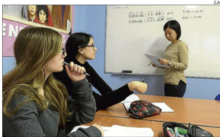
Una de les classes de preparació per a l'examen de japonès

► Una escola d'idiomes de Manresa ofereix per primera vegada cursos de preparació per a l'examen oficial de la llengua asiàtica ► El centre reconeix que aquestes classes cada cop tenen més adeptes a la ciutat